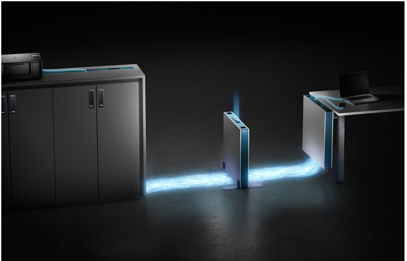
Kabel- und Datenmanagementsystem Enercon | Systementwurf W. Blume